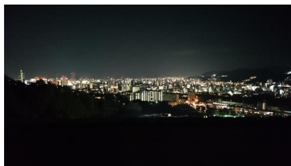
神田山荘からの夜景